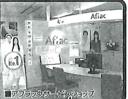
■アフラックサービスマンショップ