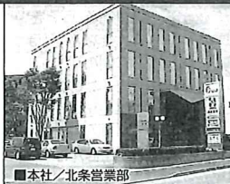
■本社 / 北条営業部